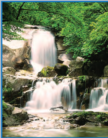
Las huellas digitales de un Dios Creador están a nuestro alrededor.

Algunos dicen que nadie creó nuestro mundo - las plantas, animales y la gente que vive aquí. Dicen que nuestro universo llegó a existir por sí mismo, y que de algún modo la vida llegó a la existencia por casualidad, por algún accidente inexplicable. Enseñan que la vida empezó con simples células –probablemente en el mar – que después se desarrollaron en criaturas diminutas compuestas de muchas células. Luego esos pequeños seres se desarrollaron durante millones de años en criaturas más complejas que se trasladaron del mar a tierra seca donde les crecieron patas. Según la teoría, algunas de estas criaturas siguieron desarrollándose hasta caminar en cuatro patas. Finalmente aprendieron a pararse, se convirtieron en monos, luego simios y finalmente en seres humanos. La Biblia tiene una respuesta muy diferente a estas preguntas de origen. Dice que hemos sido creados por un amante Dios Creador.